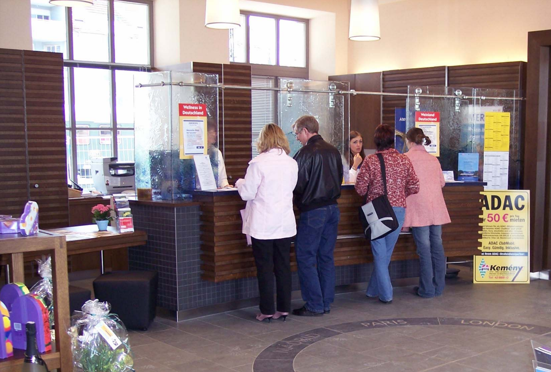
Mobilagentur: Fahrkartenverkauf und Beratung